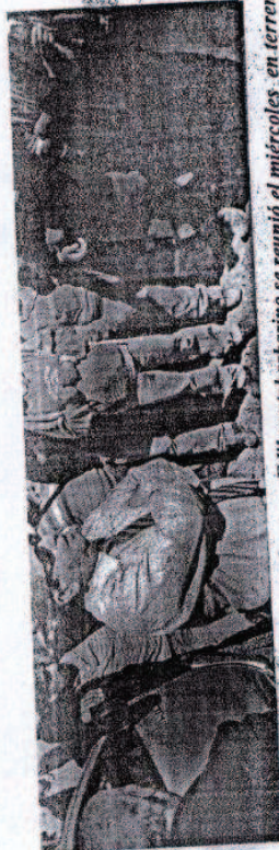
Edil santabarbarino se reunió el miércoles en terreno con ellos y posteriormente los recibió en su despacho.